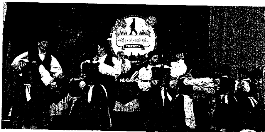
Továbbképző 8. Mákvirág csoport a Rippl-Rónai Fesztiválon 2016. Kaposvár