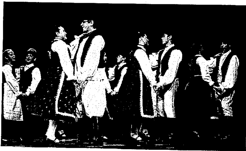
Továbbképző 7. osztály Bakarasz Tóth Ferenc Koreográfiai Verseny 2016. Szekszárd

A tehetséggondozás a művészeti iskola alap feladata, mely az utóbbi években kiemelt feladat lett. Megteremtettük a lehetőségét, hogy a kiemelkedő tehetségű néptáncot tanuló diákjaink külön foglalkozáson fejlesszék tudásukat.