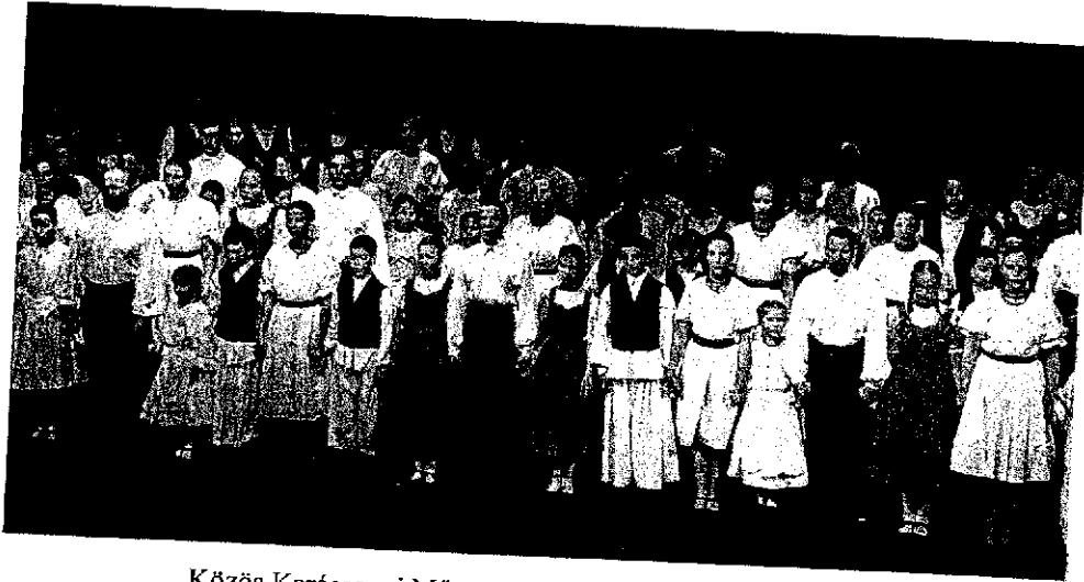
Közös Karácsonyi Műsor a Somogy Táncegyüttesrel 2015.

Olyan együttműködésre van szükség, amely lehetővé teszi, hogy a tehetséges középiskolás tanulóink részt vegyenek az együttes minden napi munkájában. Ennek a feltételeit folyamatosan alakítjuk ki. Keressük azt az optimális megoldást, mely a művészeti iskolának és a Somogy Táncegyüttesnek is megfelel.