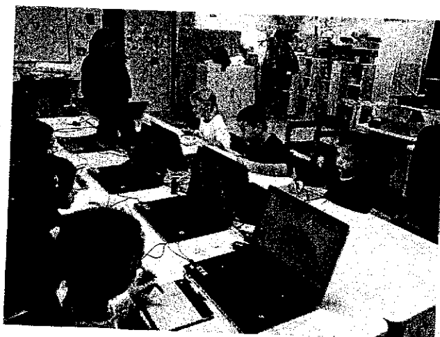
Digitális tábla használata (szakkör) 2015.

Terveim között szerepel, hogy hatékony kapcsolatot építsünk ki a Kaposváron működő Zichy Mihály Iparművészeti Szakgimnázium és Kollégiummal. Az iskolánkban tanuló felső tagozatos tanulóinkkal megismertethetjük az ott folyó munkát, a helyi tantervünkhöz kapcsolódóan segíthetjük az oda felvételizők felkészülését.