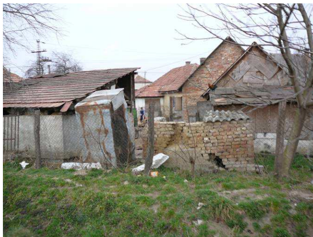
Utcakép a Szentjakabi szegregátumban