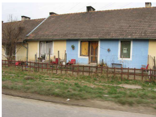
Nádasdi u. Önkormányzati bérlakássor

A Lakóházak állapota a szegregátum területén elhanyagolt, a házakat sok esetben különféle hulladék jellegű építmények veszik körbe. A háztáji állattartás egy-két helyen megfigyelhető, de nem jellemző. Az utak többségében szilárd burkolatúak, jó állapotúak. A szegregátum azon részein, ahol a szilárd burkolat hiányzik és belterületbe tartozik, ott a fejlesztési tervben szerepel az utak 100%-os pormentesítése.