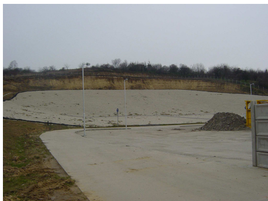
Az alakuló hulladéklerakó