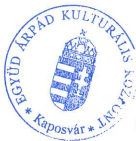
Szalay Lilla igazgató